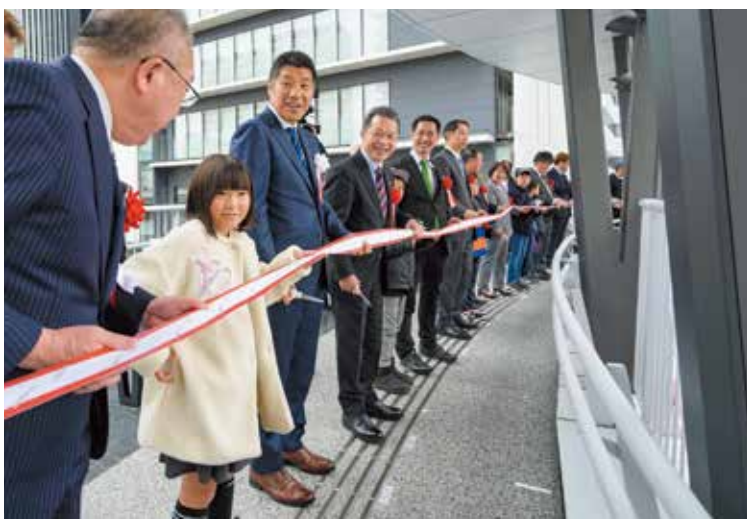
△浜田小学校4年生の皆さんとよんまるテラスでテープカット

本市では、近鉄四日市駅周辺からJR四日市駅を結ぶ中央通りを、歩行者中心の空間につくり変える「中央通り再編事業」に取り組んでいます。今年度、近鉄四日市駅の東側では、10月に大規模な車道の切り替えが完了。さらに、12月20日には、中心市街地再開発のシンボルともいえる近鉄四日市駅前の円形デッキが完成し、供用を開始しました。供用開始に先立ち開催したオープニングセレモニーでは、約1万件の円形デッキ愛称案から、市民投票を経て選ばれた愛称「よんまるテラス」を発表し、新たな本市のシンボルとしてのスタートを華々しく飾ることができました。