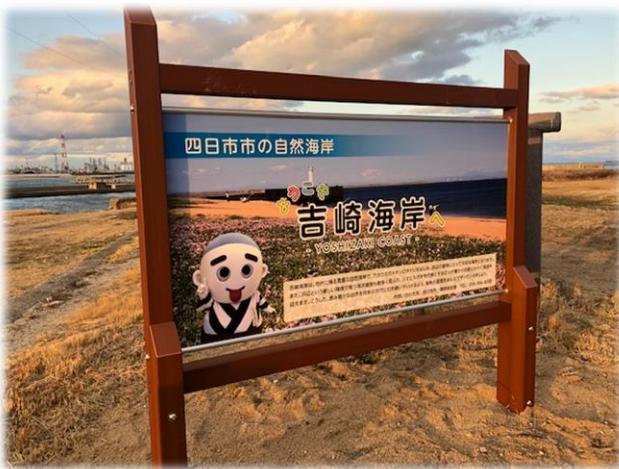
入口看板「ようこそ吉崎海岸へ」