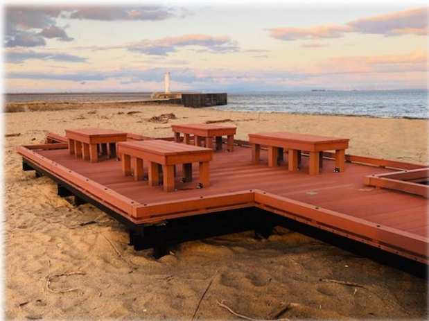
観察路内のベンチ