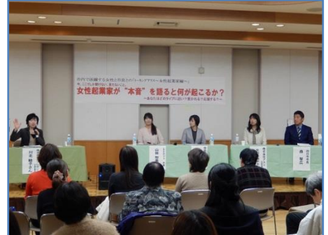
【パネルディスカッションの様子】

第2部は、女性起業家を取り囲んでの交流会を行いました。交流会は自由参加でしたが、多くの方が参加され、この機会にと、いろいろ質問されたり、情報交換や連絡先の交換などされていました。このディスカッションが、これから起業しようと考えている方の後押しになればうれしいかぎりです。