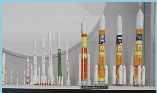
本物そっくりのペーパークラフトは必見！ (1/100サイズ)