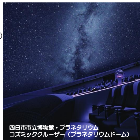
四日市市立博物館・プラネタリウム コスミッククルーザー (プラネタリウムドーム)