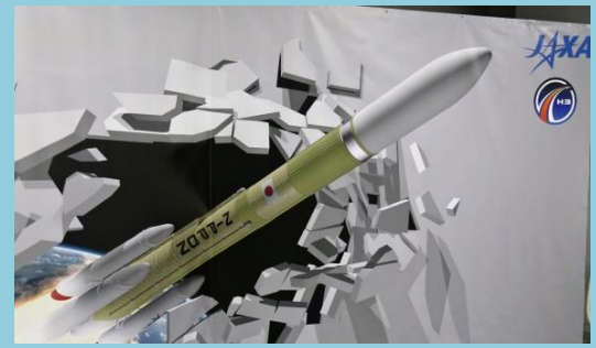
飛び出すH3ロケットの前で写真を撮ろう！