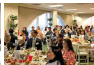
記念式典・レセプション