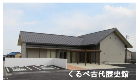
くるべ古代歴史館