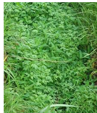
アメリカセンダングサ (キク科)