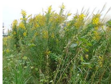
セイタカアワダチソウ (キク科)