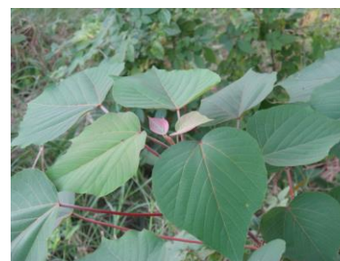
アカメガシワ (トウダイグサ科)