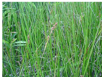
アンペライ (カヤツリグサ科)