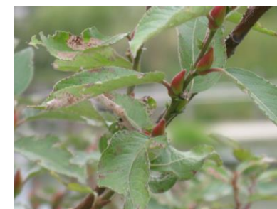
アカメヤナギ (ヤナギ科)