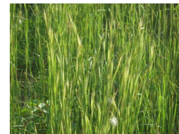
メリケンカルカヤ (イネ科)