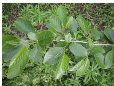
ハンノキ (カバノキ科)