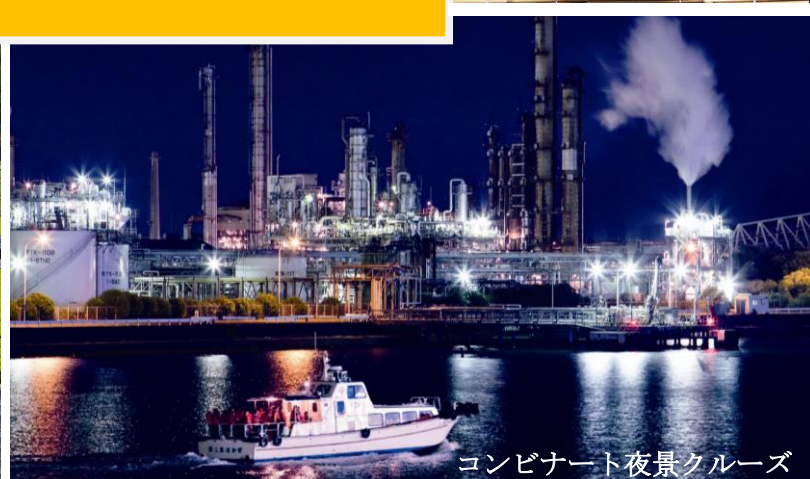
コンビナート夜景クルーズ