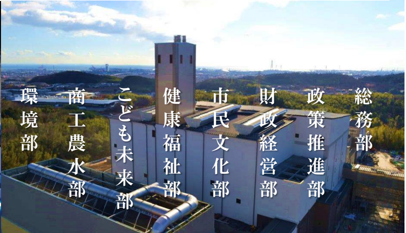
平成 28 年 4 月 四日市市クリーンセンター稼働