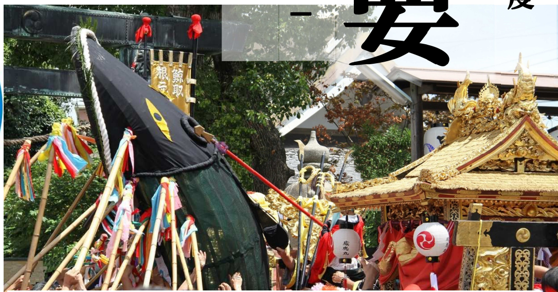
平成 28 年 12 月 鳥出神社の鯨船行事がユネスコ無形文化遺産に登録