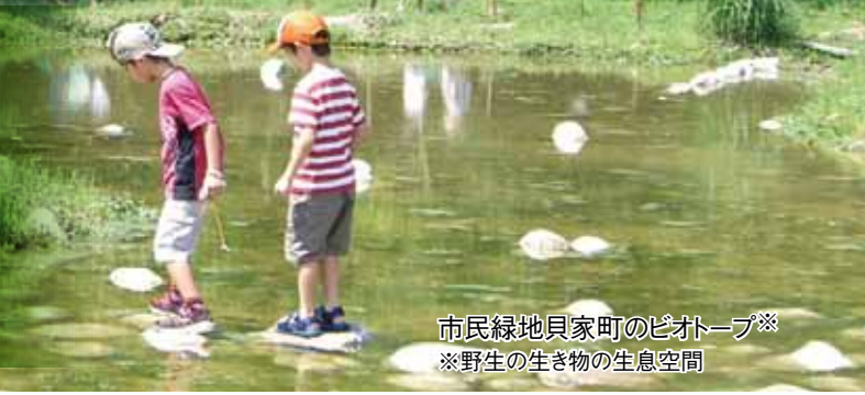
市民緑地貝家町のピオトープ※ ※野生の生き物の生息空間

本市は、鈴鹿山系から伊勢湾に至る多彩な自然環境や公園、街路樹などのさまざまな緑に恵まれたまちです。また、里山の保全や新たな緑を創出する活動に多くの市民の皆さんが取り組んでいます。緑あふれるまちづくりを一層進めていくには、市民・市民活動団体・企業の参画が大切です。市の制度を活用し、一緒に緑あふれるまちづくりに取り組んでみませんか。