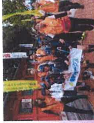
スマートウエルネスぎふ 健康ウォーク2014 11/2(日)