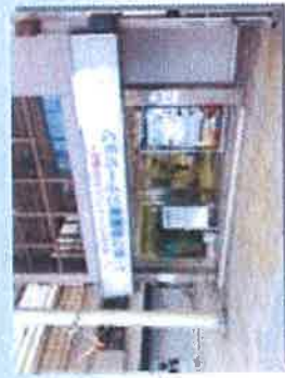
岐阜市津ヶ瀬健康ステーション