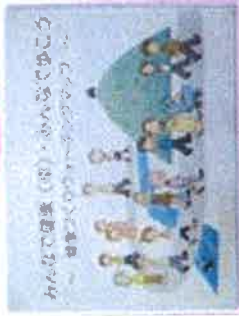
ウォーキングマップ