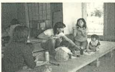
あかまんまは、地域の親子が集う場です。 どうぞ、気軽に遊びに来てください