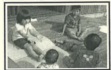
異年齢とのかかわりも普段の生活のなかにたくさんあります。