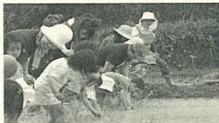
6月 田植え お父さんお母さんと一緒に「田植え」をします。秋の収穫が楽しみ！

子どもが楽しめること（子どもが主人公）、職員と保護者が子どもたち一人一人の成長・発達を喜び確認し合うことを大事にしています。「くう・ねる・あそぶ」の生活を大切にしています。