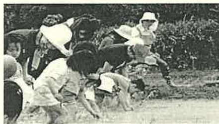
6月 田植え お父さんお母さんと一緒に「田植え」をします。秋の収穫が楽しみ！

子どもが楽しめること（子どもが主人公）、職員と保護者が子どもたち一人一人の成長・発達を喜び確認し合うことを大事にしています。「くう・ねる・あそぶ」の生活を大切にしています。