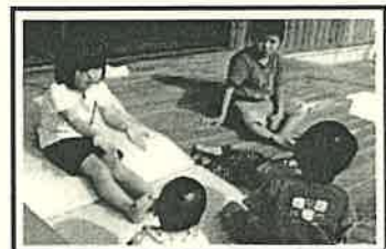
異年齢とのかかわりも普段の生活のなかにたくさんあります。