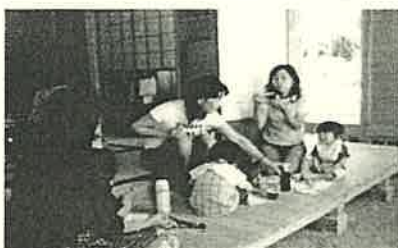
あかまんまは、地域の親子が集う場です。 どうぞ、気軽に遊びに来てください