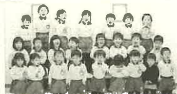
もりのくにコンサート☆☆