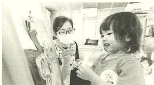
毎朝の笑顔弾ける英会話レッスン☆☆