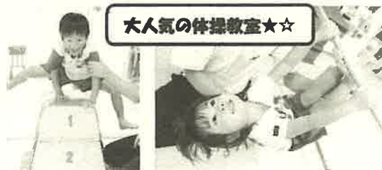
大人気の体操教室☆☆

※慣らし保育期間は設けていませんので、入園時から通常通りの保育をさせていただきます。