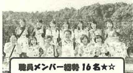
職員メンバー総勢 16名☆☆