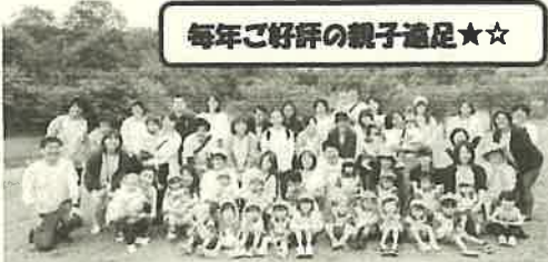
毎年ご好評の親子遠足☆☆