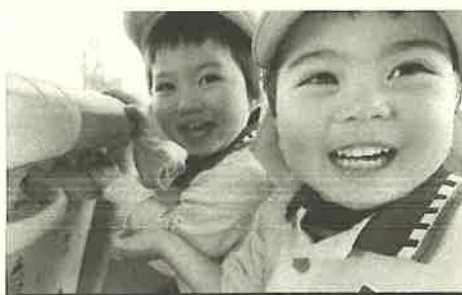
毎日弾ける! とびっきりの笑顔☆☆