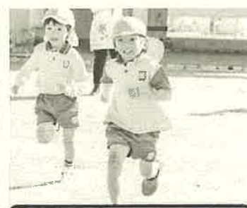
元気いっぱいの運動会☆☆