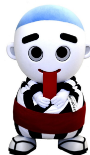
こにゅうどうくん MIE TERRACE