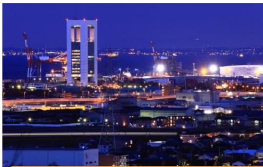
展望台からの夜景