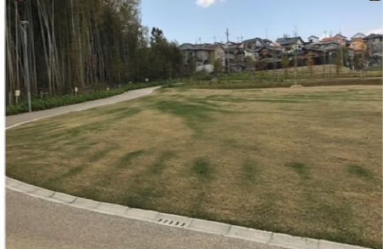
南西部の新しいエリア