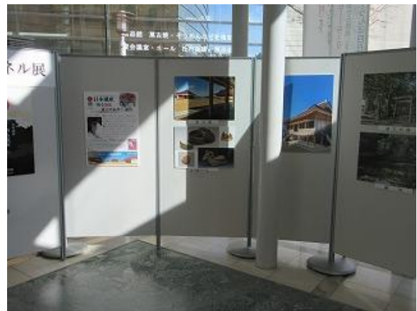
四日市市立博物館（1階ロビー）での展示の様子