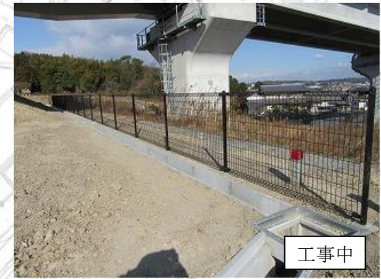
フェンス・雨水排水溝設置