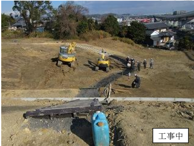
北地区散策路整備