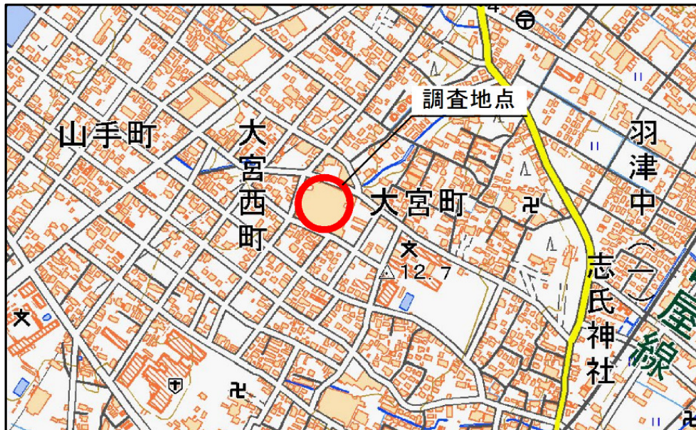
国土地理院発行数値地図 10000 に加筆