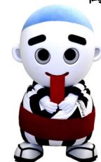
こにゅうどうくん