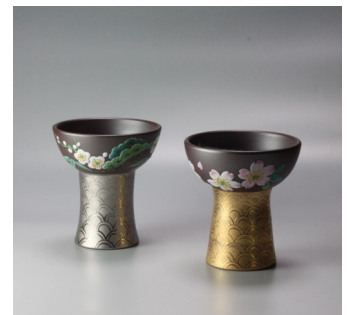
萬古焼盛絵の酒盃