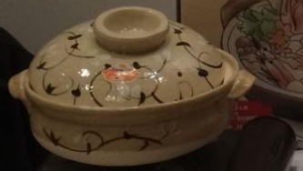
土鍋 gebrannter Tontopf

Hazu Orange Party Unsere Gruppe hat ihren Sitz in der Hazu-Zone (Bezirk am Meer) der Stadt Yokkaichi-shi / Mie Präfektur. Die Gründung fand in diesem Jahr statt. Unser Ziel ist, diesen Stadtteil aufleben zu lassen, wo alle, vom Kind bis ins Alter hinein, lebendig sein können. Hier stellen wir den "Donabe" vor, ein in lokales Erzeugnis aus Yokkaichi: ein Topf aus Steingut sowie ein Eintopfgericht, das ein gesunde, typisch japanische Hirsenmehlkost im Winter ist. Mit in dem Steingutopf aus Yokkaichi-shi, der 80% Marktanteil an der inländischen Produktion von Donabe hat, können Eintopfgericht im Winter zusammen mit der Familie oder Freunden bei Donabe Party's genossen werden.