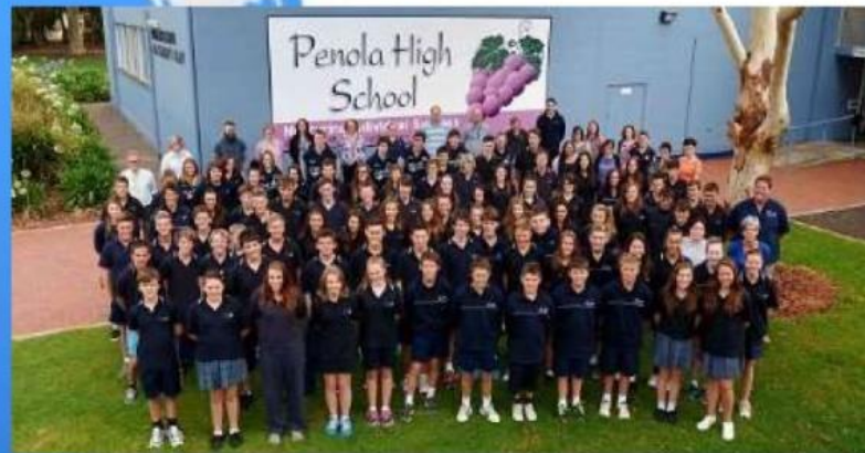
～ オーストラリア・ペノラハイスクール ～