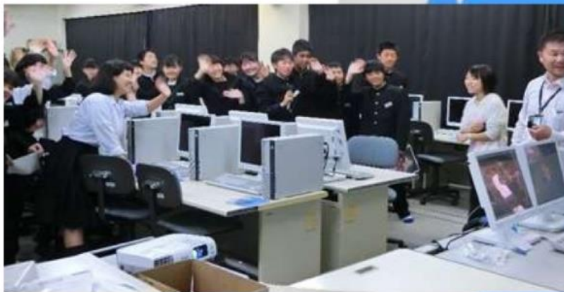
～ 西橋内中学校 ～