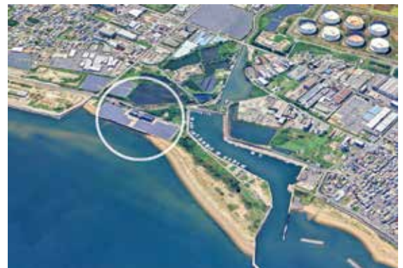
吉崎海岸に隣接して設置されている太陽光パネル