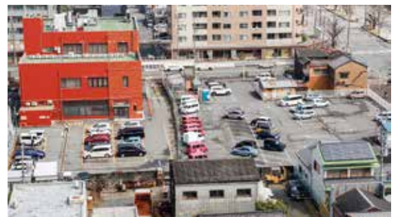
施設整備が予定されている市役所北側民有地

市長 図書館のアウトリーチサービスとして、自動車文庫や電子図書館がある。電子図書館は来館せずに利用でき、学校での朝読等でも利用されている。また、図書館とあさけプラザ図書館、楠交流会館図書室とは連携してサービス提供している。他市事例も参考にしながら、市民が本に親しみやすい環境づくりを検討する。