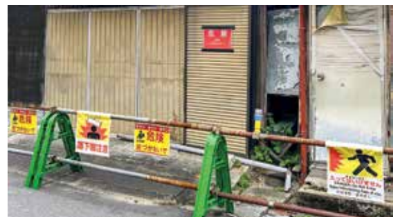
落下物や倒壊の危険がある空き家

市長 本市独自に中学校給食費月額6000円のうち1100円を公費負担し、保護者の負担を抑制している。中学校給食費の負担軽減については、さまざまな教育課題がある中で、教育施策の全体像を踏まえ、総合的に判断していく。