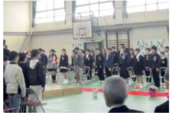
学校での卒業式の様子

議員 学校教育で国際儀礼を教えることは極めて重要である。また、思想信条の自由を理由に他者の権利を侵害する行為を助長させないため、実効性のある調査と適切な指導を求める。