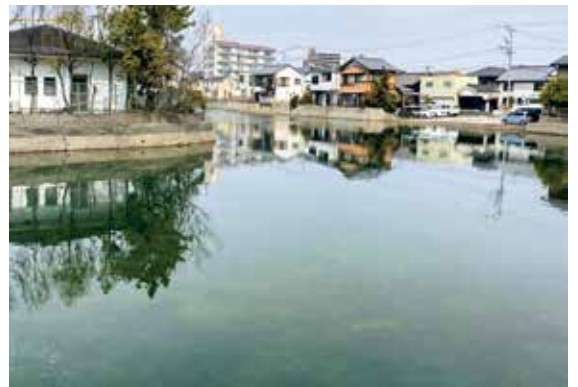
富洲原地区にある住吉運河

政策推進部長 管理組合が護岸を点検した結果、直ちに崩落等の危険はないが、令和8年度から富洲原水門の耐震補強工事ができるよう実施設計を進めている。引き続き住民の安全確保のため、適切な点検と補修の実施を求めていく。