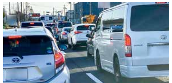
市内の渋滞の様子

市長 自治会に依頼する回覧資料の削減や会議のDX化の支援など、自治会の負担軽減に取り組んできた。令和7年度に実施した「地域活動」をテーマにした地域との意見交換や、自治会などへのアンケート調査の結果を踏まえ、改めて自治会への支援のあり方の検討を進めていく。