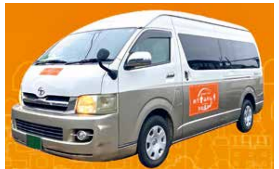
AI活用型乗り合いデマンド交通「のり愛みかん号」

都市整備部計画担当部長 令和7年度は延べ709人が利用し、個別に予約方法を説明する等、利用者目線の対応に努めた。今後は検証結果に基づき、持続可能な公共交通網の構築を目指す。