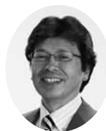
公明党 中川 雅晶