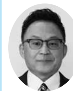
公明党 山口 智也