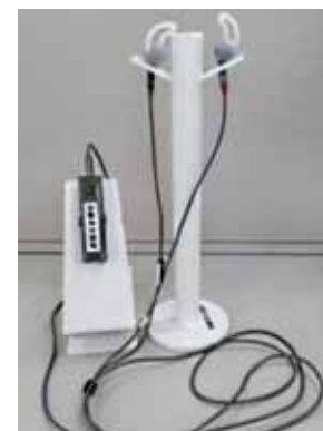
集音器付き軟骨伝導イヤホン

健康福祉部長 現在、医療機器である補聴器の購入補助制度について検討している。軟骨伝導イヤホンの補助については、その需要や効果、必要性について研究したい。