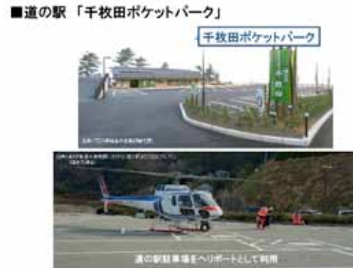
令和6年能登半島地震で活用された防災機能を持つ道の駅

市長 全国植樹祭の開催は大きな意義があると考えており、三重県での開催が決まれば、本市への招致に向けて前向きに取り組む。