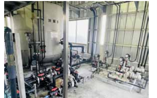
県が所有する活性炭処理設備

上下水道事業管理者 深井戸は掘削や揚水設備が非常に高額であり、また、平成24年度の調査結果では水道法上の水道水の水質基準を満たさなかったため、深井戸の整備は考えていない。