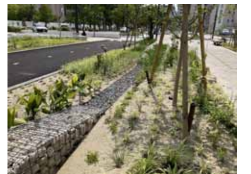
中央通り再編事業で整備した雨庭

館副市長 こども未来部をはじめ、福祉、教育を含めた関係施策を全庁的に確認したい。