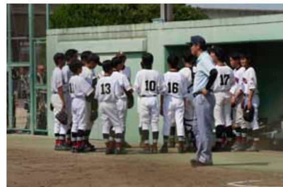
三重県中学校総合体育大会三河地区予選での部活動の様子

議員 持続可能な活動の場を生徒に提供するため、市内をブロックに分け段階的に取り組むなどして、部活動の地域移行を早急に進める必要がある。「子どもの最善の利益」となるよう可能な限り多くの選択肢を用意し、誰一人取り残される子どもがいないようにしてほしい。