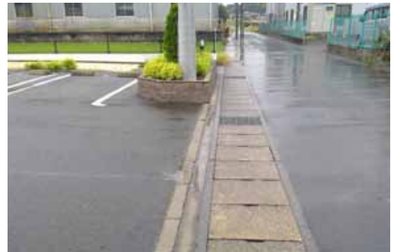
暗渠化によって下水道使用料が不要となった場所

議員 市民からの問い合わせを苦情と捉えるのではなく、信頼関係を高めるチャンスと捉え、市民の意見に真摯に耳を傾けてほしい。