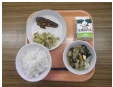
小学校給食の献立の一例

議員 学校給食の保護者負担分は年間約12億円で、本市の総予算額の約1%である。市長は「子育てするなら四日市」と掲げるのであれば、思い切って給食費の無償化を実現してほしい。