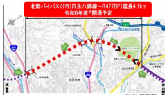
開通に向けて整備が進む北勢バイパス

議員 市はIoTと企業をつなぎ、企業が技術を生かして創造性や専門性を高めていけるような取り組みを支援してほしい。