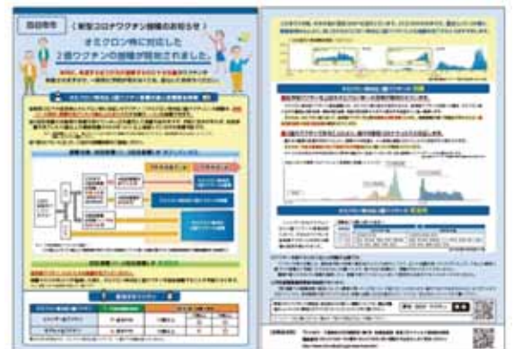
ワクチン接種券発送時に同封するチラシ

議員 市民にワクチン接種のメリット、デメリットが伝わるように積極的な情報発信が必要である。市は保健所政令市として使命感を持って市民の安全安心に取り組んでほしい。