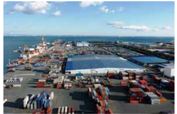
エネルギー確保に向けて大きな役割を担う四日市港

議員 エネルギー問題の対策については、本市単独ではなく県とも十分に連携し、必要に応じて国にも要望を上げてほしい。また、多くの地下資源を輸入している四日市港において、これまで以上に円滑な受け入れ体制を整えることが港と産業の発展につながる。電力の安定的な確保に努め、本市の産業と市民の安全のために企業等関係者が手を携えて取り組んでほしい。