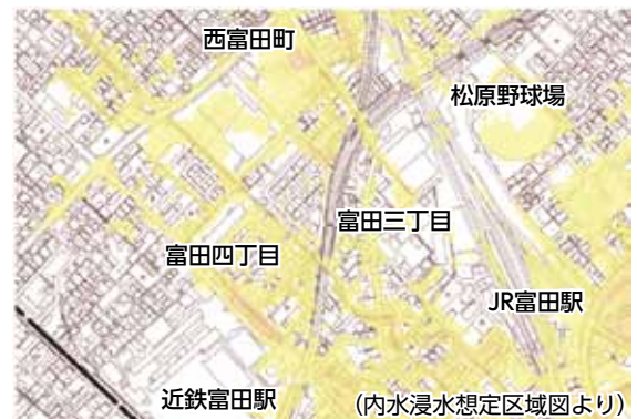
道路冠水が起きる大矢知・富田地区での雨水排水対策が求められる

危機管理統括部長 地域の声や道路、水路を管理する部局からの情報の把握にこれまで以上に努め、さまざまな声や情報を関係部局の治水対策等に生かせるよう関わっていきたい。