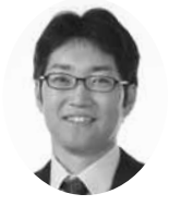
日本共産党 豊田 祥司