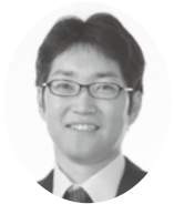
日本共産党 豊田 祥司