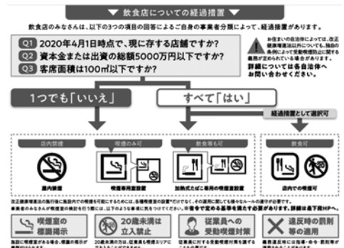
飲食店の全面禁煙に向け3つの分類で経過措置が適用される

議員 喫煙に対する風当たりが強まり、喫煙場所が減っているが、昨年度のたばこ税による本市の歳入は約22億円であり、喫煙に伴う税金がある以上、本市には喫煙者向けの取り組みを行う責任があると考えます。喫煙専用室を整備するための各種商品もでており、本市として補助制度を設けることも検討してほしい。