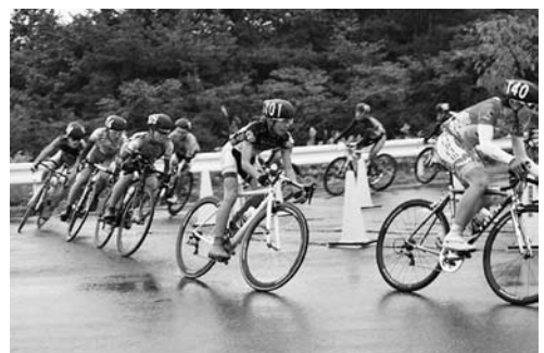
「四日市サイクル・スポーツ・フェスティバル」