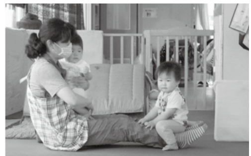
保育所で働く方への支援が求められる