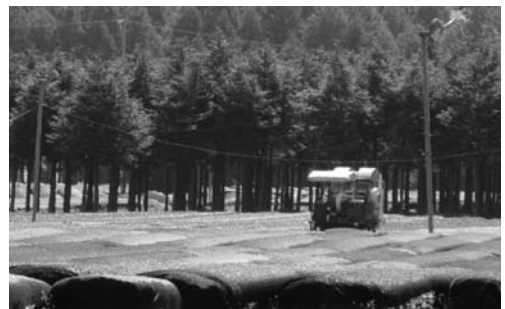
お茶の生産者に対する支援が求められる

議員 かぶせ茶の魅力を広め、生産者が誇りを持って茶業を継続できるような支援を強く望む。