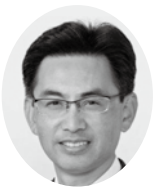
公明党 樋口 博己