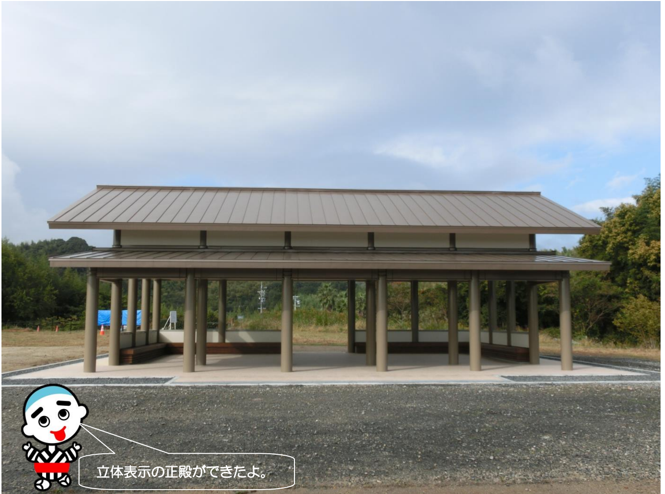
久留倍官衙遺跡の正殿の立体表示(復元建物ではない)