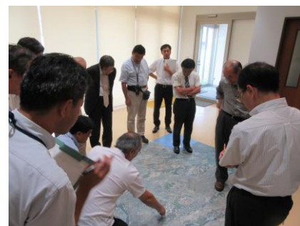
ホールで航空写真の検討