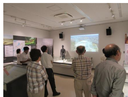
学習展示室の映像展示の検討