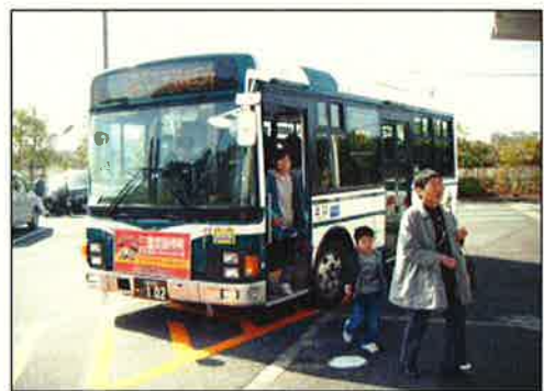
待望のイオン乗入れ第 1 便。お孫さんと一緒にお買い物。