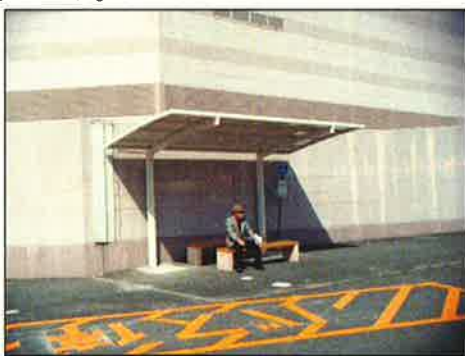
イオン四日市尾平店により設置されたバス停屋根と路面表示、いす。経費は、約 50 万円。

④事業者では、バス乗客への買い物サービスなどインセンティブを検討中。交通事業者の協力により、ポイントカードへの日付押印等当日乗車の確認が可能となれば、早期実現する見込み。