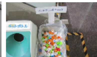
②ペットボトルのキャップ回収