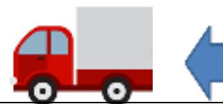
④リサイクル業者に運搬