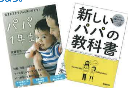
安藤哲也(著)/かんき出版

夫婦共働きで時間がないときは、清掃など家事の代行サービスを利用するのも一手です。