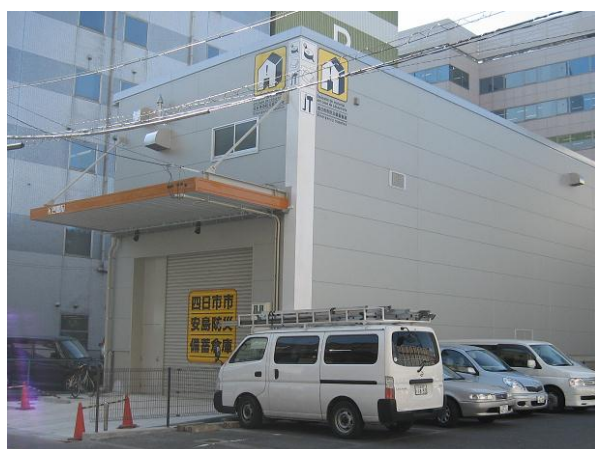
防災備蓄倉庫（安島）

各指定避難所に防災倉庫を併設するほか、3 カ所に防災備蓄倉庫を設置し、食料（クラッカー、アルファ米）や毛布、仮設トイレ、担架のほか、ノコギリ、ツルハシ、ハンマー、バール等の救出救助用資機材の備蓄に努めている。同様に、水防倉庫についても整備・充実に努めている。（平成 27 年 4 月時点防災倉庫は 125 カ所、水防倉庫は 53 カ所）