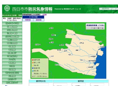
【水防情報(雨量、河川水位など)】