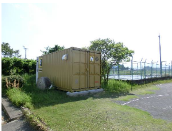
防災備蓄倉庫（西朝明中）

市内各所にきめ細かく防災備蓄倉庫の整備を図るとともに、食料（クラッカー、アルファ米）や毛布、仮設トイレ、担架のほか、ノコギリ、ツルハシ、ハンマー、バール等の救出救助用資機材の備蓄に努めている。同様に、水防倉庫についても整備・充実にも努めている。（平成 25 年 4 月時点での防災備蓄倉庫の設置個所は 130 カ所、水防倉庫の設置個所は 53 カ所）