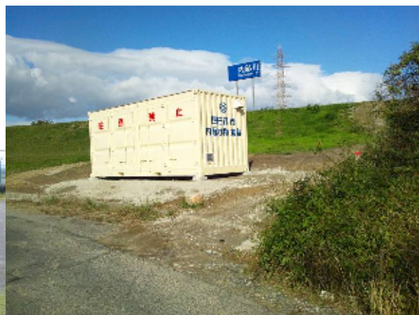
水防倉庫（内堀:内部川）