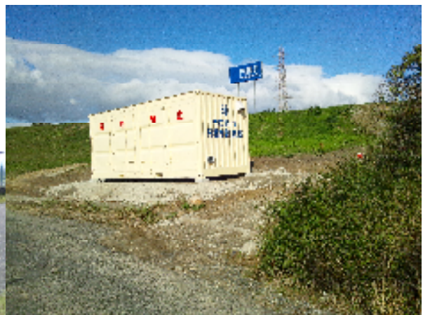
水防倉庫（H23 整備 内堀:内部川）