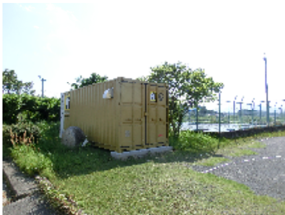
防災備蓄倉庫（H23 整備 西朝明中）

市内各所にきめ細かく防災備蓄倉庫の整備を図るとともに、食料（クラッカー、アルファ米）や毛布、仮設トイレ、担架のほか、ノコギリ、ツルハシ、ハンマー、バール等の救出救助用資機材の備蓄に努めている。同様に、水防倉庫についても整備・充実にも努めている。（平成 24 年 4 月時点での防災備蓄倉庫の設置個所は 71 カ所、水防倉庫の設置個所は 53 カ所）