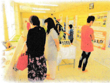
しつないてんじ 【室内展示】