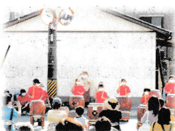
あかほりだいこ 【赤堀太鼓】