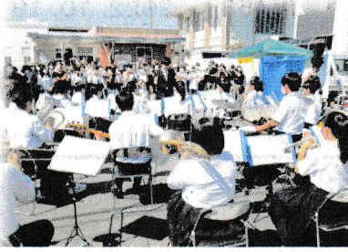
みなみちゅうがっこうすいそうがくぶえんそうはっぴょう 【南中学校吹奏楽部演奏発表】