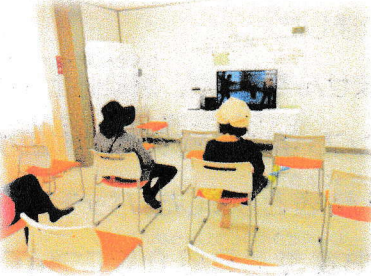
どうがしちょう 【動画視聴】