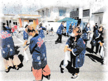
ひなが おど 【日永つんつく踊り】