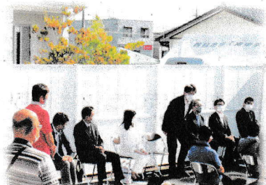
らいひんしょうかい 【来賓紹介】

規模 きぼ や時間 じかん について、まだまだコロナ禍 か 前の3年前 かまえ ねんまえ とは同じようにはいきませんでした おな が、感染 かんせん 防止 ぼうし 対策 たいさく に 配慮 はいりょ しながら、出来 でき うる限り かぎ の内容 ないよう で実施 じっし することができました。フォークダンス しゅわきょうしつはっぴょう ・手話 どうがしちよう 教室 おんがく 発表 はっぴょう は動画 おんがく 視聴 しゅつ とし、小 しょう 中 ちゅう 学校 がっこう 人権 じんけん 学習 がくしゅう 会 かい レッツ・TOMMOROW はっぴょう の発表 はっぴょう については屋外 おくがいはっぴょう 発表 はっぴょう としました。パッチワーク おんがく ・ 生花 いげばな 教室 きょうしつ 作品 さくひん や天白 てんぱく 人権 じんけん まちづくり まちづくり の会 かい ・キッズ きず スクール すくろ ・舞踊 ぶよう 教室 きょうしつ ・こども こども 食堂 しょくどう 活動 かつどう 紹介 しょうかい 等 とう については、 プラザ としょつ 図書 とくしょ 室 しつ ・ホール がくしゅうしつ ・学習 てんじ 室 しつ に展示 てんじ しました。