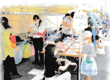
【バレーンアートコーナー】

また、12時 じ から約 やく 1時間 じかん 、前 ぜん 日 じつ 1日 いちにち の福井 ふくい 市 し で開催 かいさい された中 ちゅう 部 ぶ 日 にっ 本 ぽん 吹 すい 奏 そう 楽 がく （中 ちゅう 部 ぶ 九 きゅう 県 けん ）コンク ちゅうぶききゅうけん ール ちゅうぶききゅうけん におい て、見 み 事 こと に金 きん 賞 しょう 第 だい 二 に 位 い にいち いち ちゅう ちゅう にち にち しん しん ぶん ぶん しや しや しょう しょう かがや みなみちゅうがっこうすいそうがくぶ ねんせい みな えんそうかい に輝 かがや いた南 みなみ 中 ちゅう 学 がく 校 がく 吹 すい 奏 そう 楽 がく 部 ぶ の3年 さんねん 生 せい の皆 みな さんによる演 えん 奏 そう 会 かい があり、 大 たい 会 かい 翌 よく 日 にち にもかか か わらず参 さん 加 か し、ふれあい いっそうも まつりをより一 いっ 層 そう 盛 も り上 あ げてくれま あ した。みなみちゅうがっこうすいそうがくぶ ことし 大 たい 会 かい 翌 よく 日 にち にもかか か わらず参 さん 加 か し、ふれあい いっそうも まつりをより一 いっ 層 そう 盛 も り上 あ げてくれま あ した。南 みなみ 中 ちゅう 学 がく 校 がく 吹 すい 奏 そう 楽 がく 部 ぶ は今年 ことし で6回 かい 目 め の出 しゅつ 演 えん となりま あ した。汗 あせ ばむほ あつ どの暑 な くな えん った中 ほん での演 えん 奏 そう 、本 ほん 当 とう にありが あ とうご ご ざいま ま した。