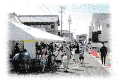
はんばい 【販売ブース】

コロナ禍により、まだまだ制約の残るいれあいまつりではありましたが、開催に際して、準備や後片付け、運営に携わっていただいた天白町やまちづくりの会、並びにボランティア、関係校・機関、南中学校吹奏楽部等の皆さん、また、事前に会場周辺の環境美化に取り組んでいただいていた方もみえました。本当にありがとうございました。人と人とが出会うことから、知り合いになり、少しずつでも、誰もが住みよい温かいまちづくりのための一助になればと切に願っています。今後ともどうぞよろしくお願いいたします。