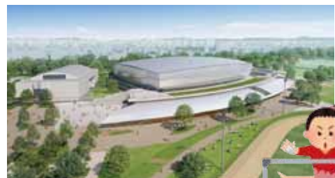
整備後の中央緑地イメージ図

国体の施設基準を満たした、十分な広さと機能を備えた新体育館を整備します。併設する第2体育館と一体的に利用することができ、多様な競技種目で、全国レベルの大会の開催が可能になります。また、新体育館は多目的室も備え、幅広い活動に柔軟に対応できる施設になります。