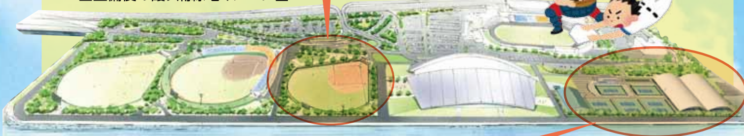
■整備後の霞ヶ浦緑地イメージ図

大会開催の機会が増えることが見込まれるとともに、学童野球の場になるなど、利用者の幅が広がることも期待されます。