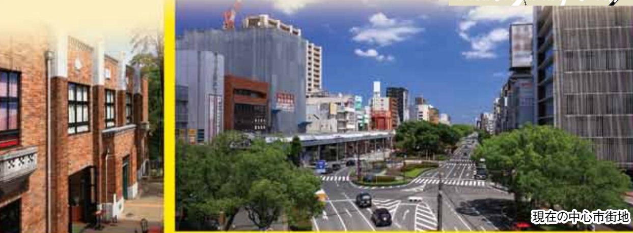
現在の中心市街地