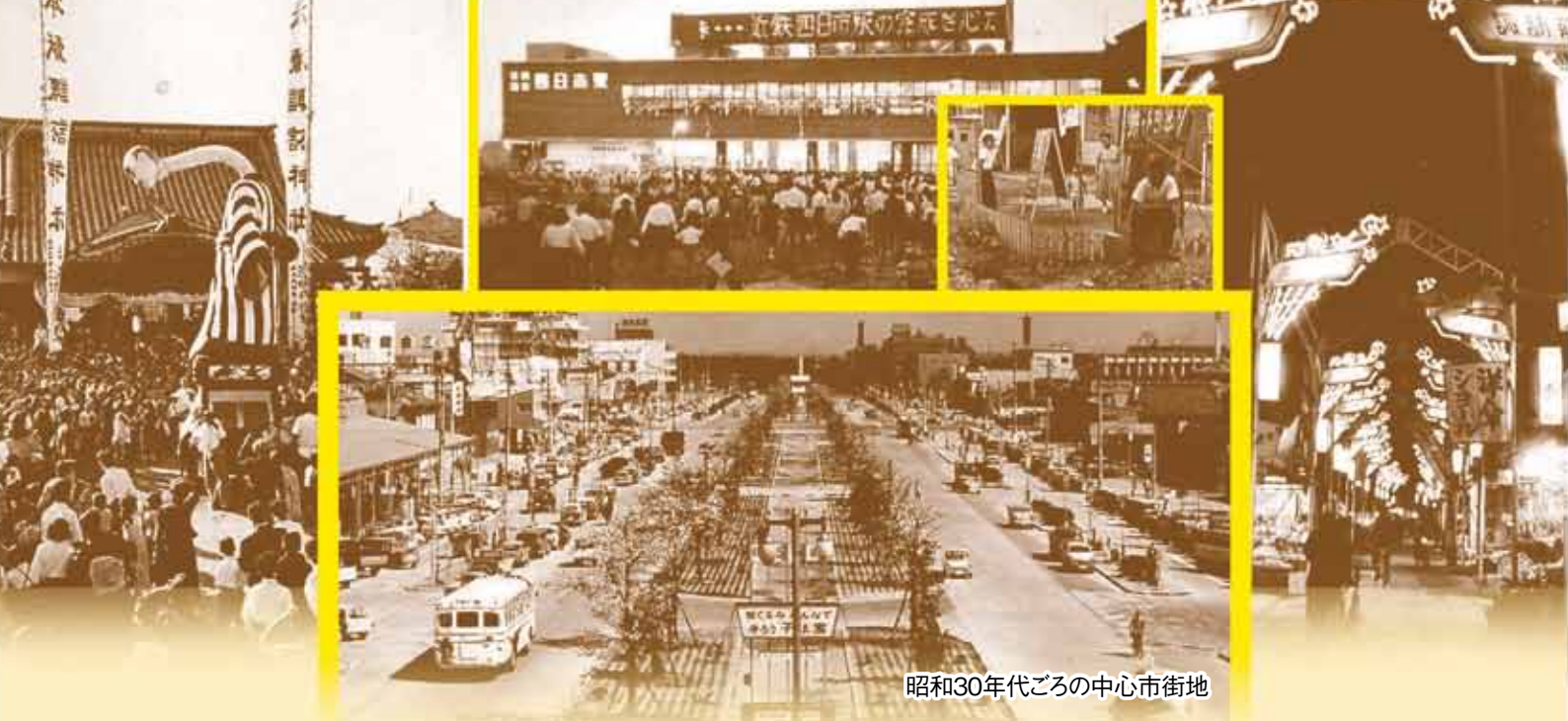
昭和30年代ごろの中心市街地