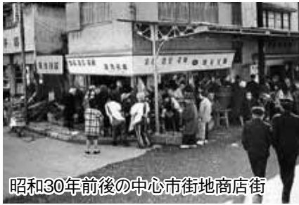
昭和30年前後の中心市街地商店街

四日市は、古くからその名のとおり、「市のまち」「商業のまち」として栄えてきました。