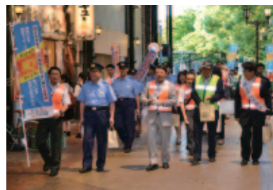
条例の啓発活動をする市長と関係者

そのために、晴れの日も雨の日も、青いベストで街角に立つ指導員たちを皆さんで応援してあげてください。