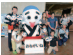
応援隊結団式で、投票を依頼する「こにゅうどうくん」