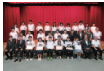
出場された中学生の皆さんと

この弁論大会を通じて、郷土への愛着や誇りを持つ“心豊かなよっかいち人”に成長してくれることも期待しています。