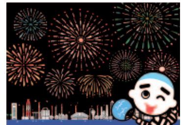
夏休みの思い出をつくらう！