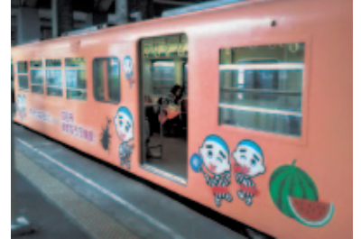
大喜利列車とコラボしたこにゅうどう列車

また、全国規模でのPRを図るため、NHKの人気番組「ケータイ大喜利」の公開収録を共催で実施し、車両へのラッピングを行いました。他にも「カブトムシ列車」や「まんじゅう列車」などのイベントを開催しており、今後も皆さんから愛される鉄道を目指していきます。皆さんからのご意見も募集しています。