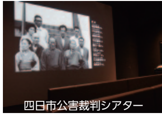
四日市公害裁判シアター

3月21日に開館した四日市公害と環境未来館の見どころや取り組みなどについてご紹介します。