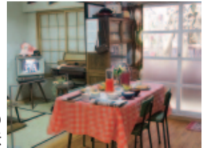
くらしの原寸大展示

また、休日にはエコ工作や環境実験など楽しみながら環境について学べるイベントも実施しますので、ぜひお越しください。