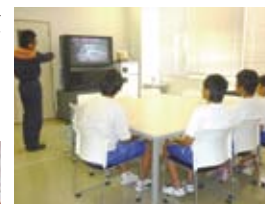
▲セミナースペース