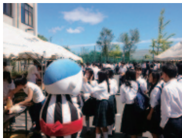
市内の学校でPR活動！