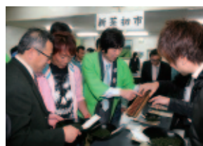
新茶初市での取引の様子

近年、急須で入れたお茶を味わう機会が減っていますが、初市会場の香ばしいお茶の香りと取引の熱