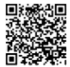
「まるごと四日市」のサイト