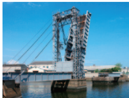
跳ね上がっている状態(末広橋梁)

このような可動橋は、明治以降、全国で80ほど作られました。鉄道用で現在も動いているのは末広橋梁だけです。