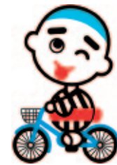
四日市市のゆるキャラ® 「こにゅうどうくん」

下のQRコードを読み取って、オリジナルアプリ「まるごと四日市」のサイトにアクセスしてね！今回は、「伊坂ダム」を紹介するよ！