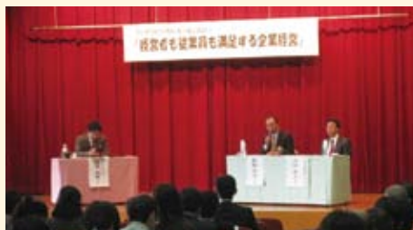
ワーク・ライフ・バランスセミナー(平成25年度)

男女が共に柔軟な働きができるように、事業者の皆さんへの啓発の場として、講演会や研修会を毎年実施しています。