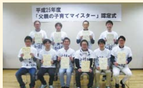
子育てマイスター認定式(平成25年度)

父親の子育て参加機会と仲間づくりの場の提供として、平成22年度から「父親の子育てマイスター養成講座」をスタート。多くのパパが「子育てマイスター」に認定され、子育て支援センターで、子育て相談員(よかパパ相談員)としても活躍中です。