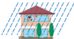
④建物内の安全な場所での待避 (2階など)

なお、災害情報や避難勧告などの避難に関する情報は、広報車、防災行政無線、市ホームページ、防災メール、緊急告知ラジオなどでお知らせします。