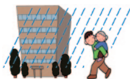
③近隣の高い建物などへの移動