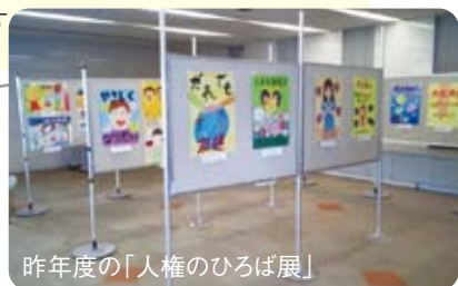
昨年度の「人権のひろば展」

※じんけんフェスタ2014の内容は、広報よっかいち10月下旬号9ページにも掲載しています