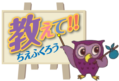
「ちえふうろう」は、市民・消費生活相談室のイメージキャラクターです。