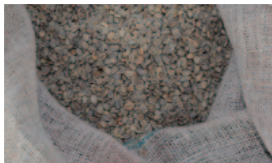
生豆の状態で購入されたコーヒー豆

海外から四日市港に運ばれてくるたくさんのコンテナ。そのコンテナの中には、実は、皆さんが日常生活で