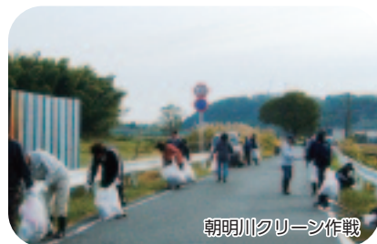
朝明川クリーン作戦

環境委員会が中心となって、毎年12月に地区の中央を流れる朝明川をはじめ、谷川、朝明新川、古城川、札場川周辺の一斉清掃を地区住民総出で行っています。「私たちの住まわちを、きれいな住みよいまちに それは私たちの手で」と平成19年から継続して実施しています。