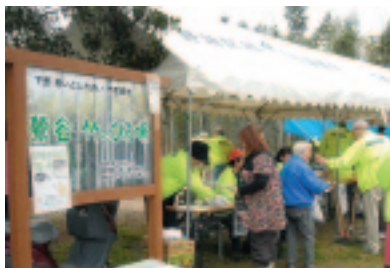
竹の子ホリホリ下野っ子

昨今、至るところで松林が孟宗竹に侵食されています。あさけが丘団地北側の里山も、以前はアカマツ林でしたが、うっそうとした竹林になってしまい、周辺的生活環境や里山保全の視点からも、地域の重要課題となりました。まちづくり委員会では、その荒廃した竹林を整備し、地区住民の憩いの場所として、かつての緑豊かな景観を取り戻そうと平成21年から本格的に活動を開始しました。月に3回、ボランティアを募って、樹木の伐採や除草、散策路づくりなどを行っています。