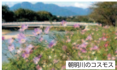
朝明川のコスモス

下野地区は市内北西部に位置し、面積7.57km 2 、人口8,544人、世帯数3,454世帯、中央に朝明川が流れ、朝明町、山城町、札場町、北山町、西大鐘町、大鐘町、あさけが丘、八千代台の8町で構成されています。(8月1日現在)