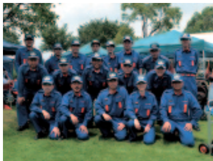
大矢知分団の皆さん