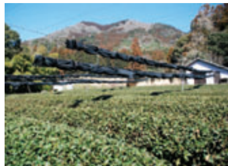
農林水産大臣賞を受賞した茶畑

いいお茶を、急須で飲んで欲しいですね。急須で飲むと、カテキンがたっぷりとれて、健康に良いことはもちろんですが、時間をかけて、お茶をいただくことで、一緒に飲む人とのコミュニケーションをはかることができ、人の輪、つながりをつくることにもなります。ぜひ、急須でゆっくり時間をかけてお茶を飲む機会をつくってください。