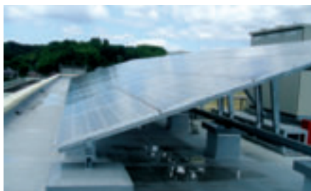
校舎屋上の太陽光発電