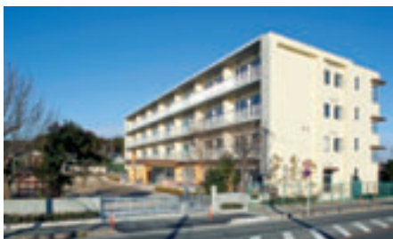
河原田小学校新校舎

新校舎屋上には、太陽光発電を設置しており、児童の環境学習用として、また非常用電源として活用が期待できます。