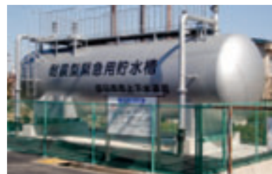
耐震型緊急用貯水槽

昨年は、持病やかかりつけ医、緊急連絡先などを記入した用紙をプラスチック容器に入れて冷蔵庫に保管し、災害や急病などの場合に、駆け付けた救護者や救急隊員に必要な情報を伝える「救急医療情報キット」を全戸配布するなど、住民みんなで「防災のまちづくり」に取り組んでいます。