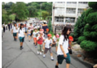
平成23年度の避難訓練の様子

平成23年には、大規模地震・津波を想定して、住民と四日市農芸高校生が住民・小学生・園児らを避難させる1,500人規模の合同避難訓練と炊き出し訓練を実施しました。この取り組みが評価され、「みえの防災奨励賞」を受賞しました。