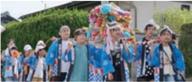
城山祭り(10月5日・6日 三重地区)

本祭り(6日)では、それぞれの町内をこどもみこしが練り歩いた後、三重西小学校で餅つきが行われ、つきたての美味しいお餅が振る舞われました。熱気球搭乗体験やミニSL機関車乗車など、楽しい企画の前日祭(5日)もあり、三重西連合自治会主催で行われた祭りを、多くの人が楽しみました。