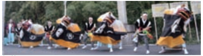
立阪神社大祭(10月12日・13日 大矢知地区)

12日、神社鳥居前で4頭の獅子が舞う「舞始め」に始まり、各氏子宅を回る「皆ならし」、夜には神社境内で「奉納舞」が披露されました。13日には、祝い事があった氏子宅で舞う「本舞い」が行われ、垂坂公会堂での「舞納め」でフィナーレを迎えました。